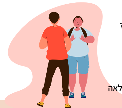
מגשרים בחינוך | מעבירים את זה הלאה

◀ איך ההרגשה? ◀ האם הרגשתם נח יותר כשהייתם שניים? עזרים: כסאות.